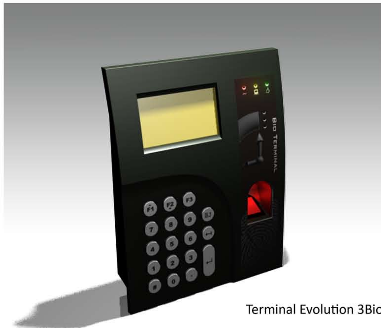
Terminal Evolution 3Bio

Utilizando la última tecnología biométrica ganadora de premios internacionales, Acronym ha desarrollado un terminal extremadamente rápido y preciso en la recogida de datos para el control de presencia. Esta nueva tecnología evita que los trabajadores de una empresa efectúen marcajes por otros compañeros, y además para eliminar la habitual disculpa del olvido de la tarjeta.